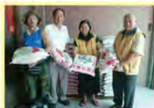
感謝「心願搖籃室」捐贈白米乙此非常感謝您們長期幫助香園