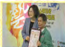
服務對象參加「第13屆身心障礙者藝術節創作聯展」由總統府文士處提供聯席證書。