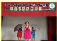
明日之星歌練演-推廣、發展的服務對象社區劇展，努力向樂天邁進