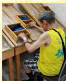
認真書健，我會越來越好