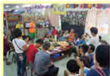
每月慶生會，一團圓心每一天