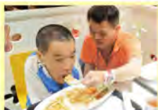
我們是朋友也是家人，彼此分享要相互幫助