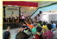
金鳳園樂團蒞臨演出予服務對象同樂