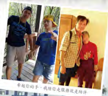
牽起你的手，我陪你走服務就是陪伴

透過組務會議的討論分享，所有老師的回響，看見許多服務的畫面。「其實幸福就是一種感覺」，工作巡班的過程中，每天在工作人員服務的畫面裡，蒐集很多感動的幸福畫面，總是可以讓我回味許久，第一線工作就是最大幸福的來源，希望我們可以蒐集更多感動服務的畫面。隨著服務對象年紀的漸長，我常常想「我不知道我能陪伴他們多久？但我能做到的就是每天帶給他們歡樂」，希望我可以帶著我的教保團隊持續前進，幫助每一個服務的個案，享受生活，享受快樂。