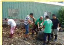
颱風過後大家一起災後重建復健美麗的香園